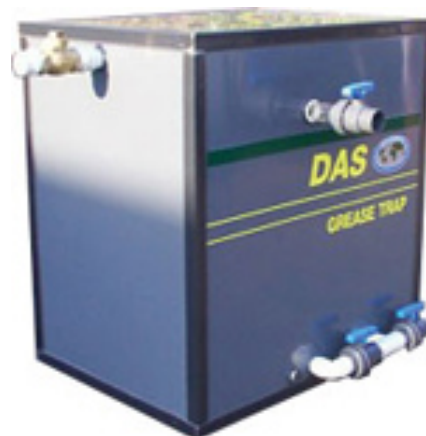
DAS GREASE TRAP™

A DAS GREASE TRAP possui um sistema de limpeza de fácil manuseio , vindo equipada com uma bomba de imersão de aço inox.